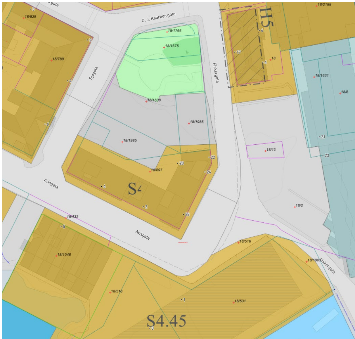
Figur3: Kommunedelplan Svoldvåg, vedtatt 2020